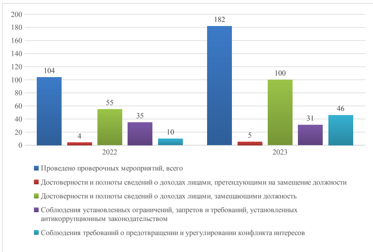
Сведения о проведенных проверочных мероприятиях

Меры дисциплинарного воздействия применены в отношении 37 лиц, в том числе в отношении 2 должностных лиц, замещающих должности государственной гражданской службы категории «руководители», 35 муниципальные должности.